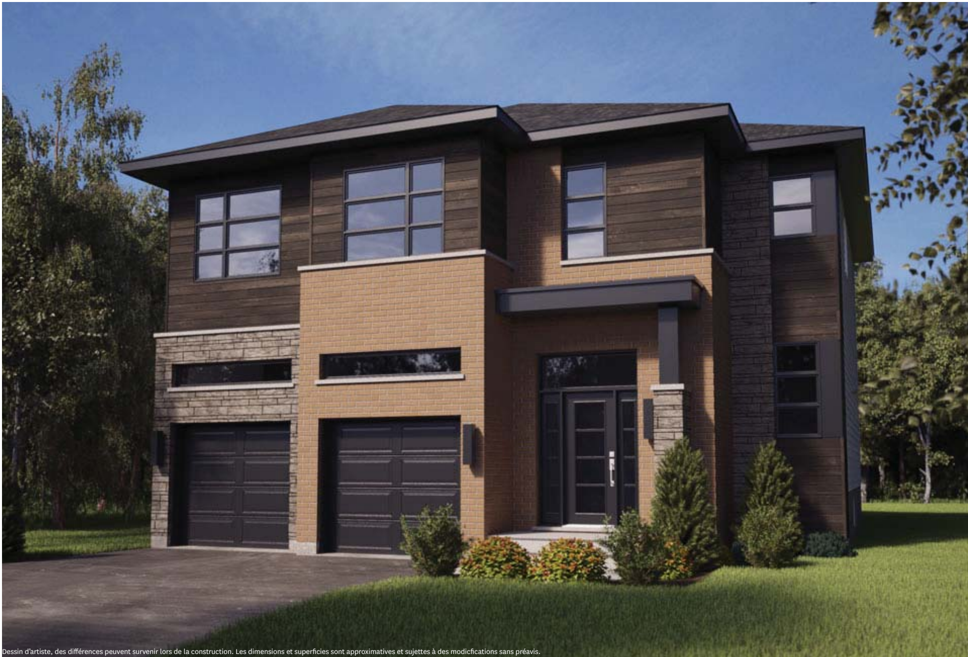
Dessin d'artiste, des différences peuvent survenir lors de la construction. Les dimensions et superficies sont approximatives et sujettes à des modifications sans préavis.